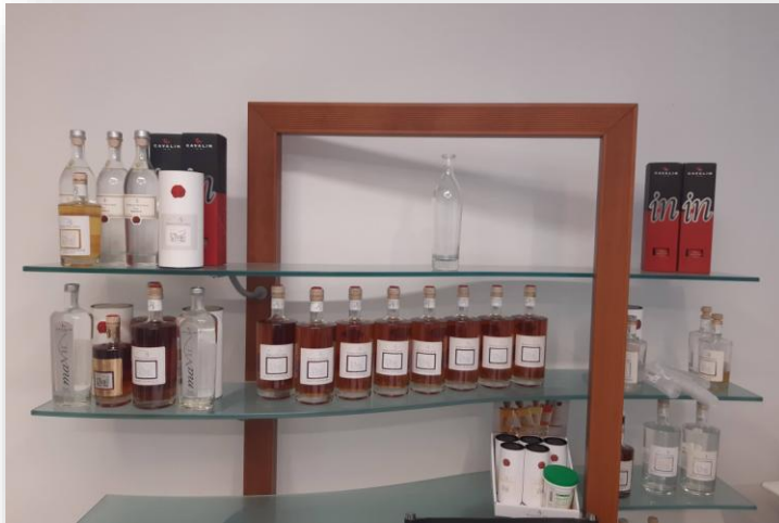
Miglioramento della produzione di distillati