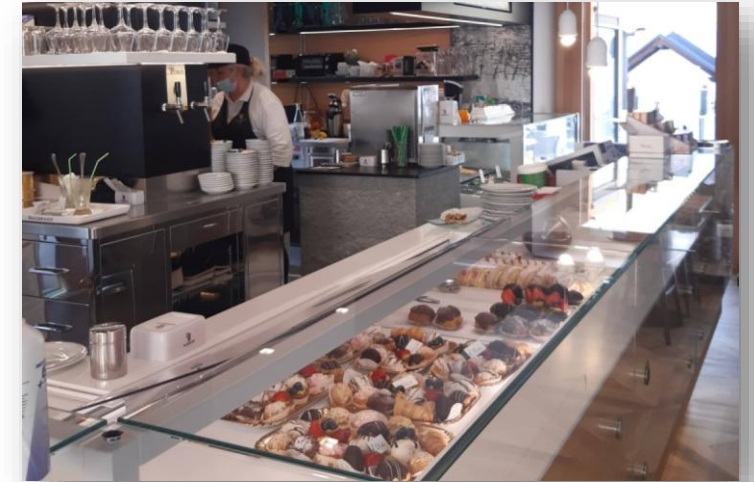
Ampliamento locali pasticceria