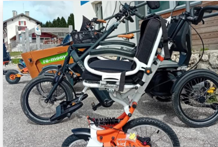
Acquisto di n. 6 e-bike 4 all