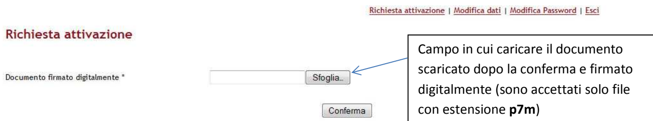
Fig. 5: Pagina attivazione

Alla fine dell'attivazione il referente dell'impresa riceverà un'email di conferma dell'avvenuta attivazione.